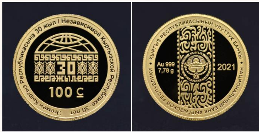
Алтын монетанын номиналы «100 сом», салмагы — 7,78 грамм.