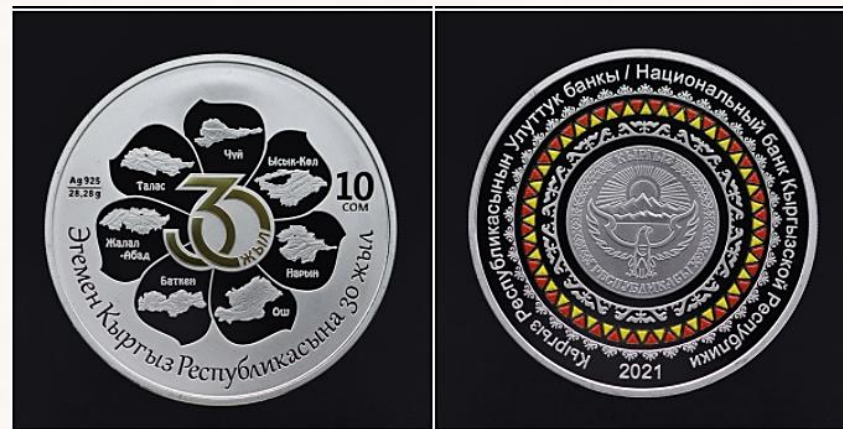
Күмүш монетанын номиналы «10 сом», салмагы — 28,28 грамм

Коллекциялык монеталар Кыргызстан аймагында расмий төлөм каражаты статусуна ээ.