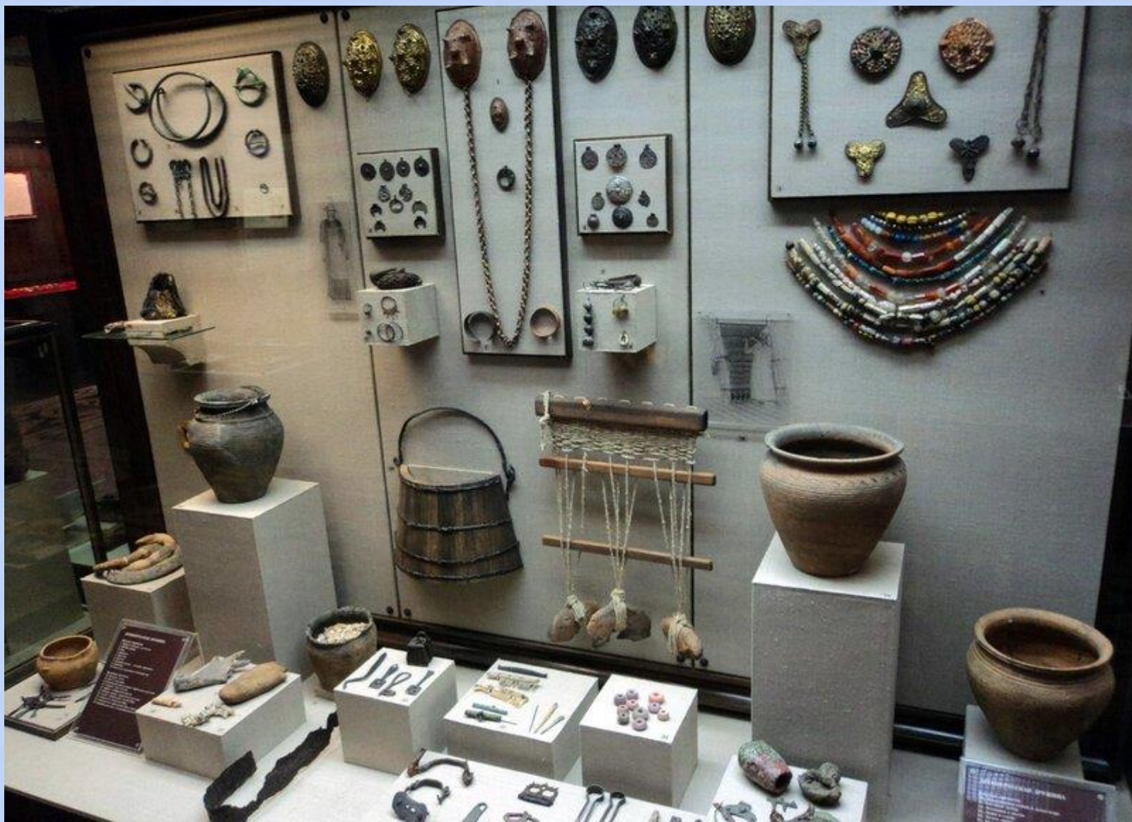
Мунун баарын элдик кол өнөрчүлөр жасашкан.